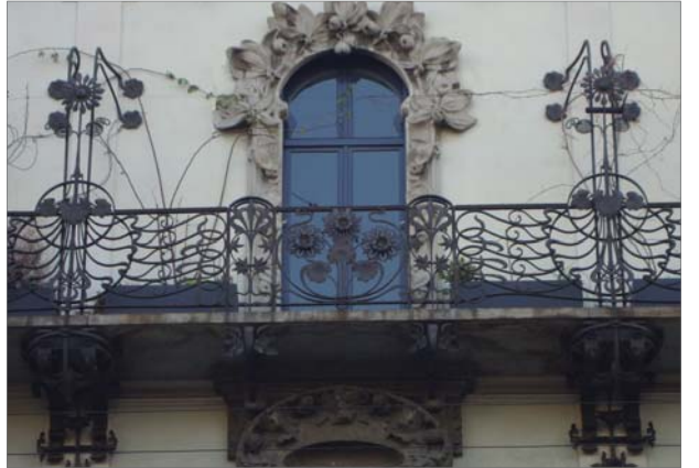
15) Casa Cambiagli | Via Pisacane 18/20/22 Casa Crocchini | Via Pisacane 24